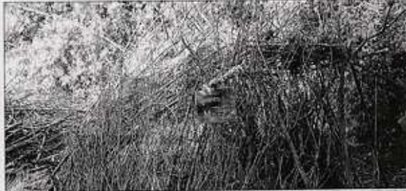
Les bûcheurs d'un jour ont ensuite profité d'une soirée gourmande et musicale.